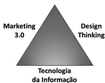
Imagem: Triângulo de ferro